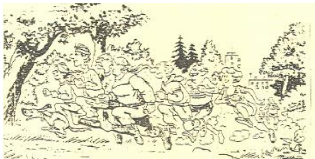
fra løpet for to-tre år siden

Startkontingent for alle klasser, kr. 50,-